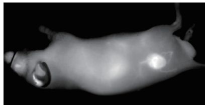
Large blood vessels and tumor